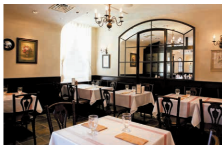
〈パーティールーム B〉 こじんまりとしたお部屋です。 10名様~16名様のご利用にどうぞ。